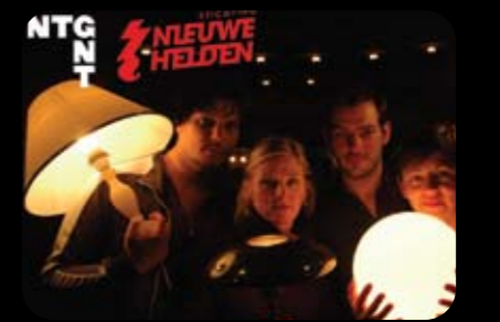
NTG Nieuwe Helden